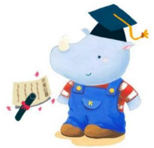
福祉共済キャラクター キョウサイくん

編集発行 吹田市都市魅力部 地域経済振興室 〒564-8550 吹田市泉町1-3-40 TEL(06)6384-1365(直通) FAX(06)6384-1292 メール:k_kyosai@city.suita.osaka.jp