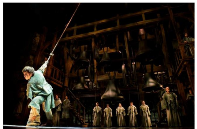
写真はこれまでの公演より