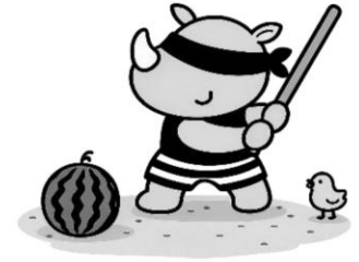
福祉共済キャラクター キョウサイくん (サマーバージョン)

編集発行 吹田市都市魅力部 地域経済振興室 〒564-8550 吹田市泉町 1-3-40 TEL(06)6384-1365(直通) FAX(06)6384-1292 メール:k_kyosai@city.suita.osaka.jp