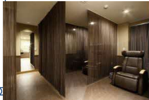
職員休憩室の一部（マッサージチェアあり）