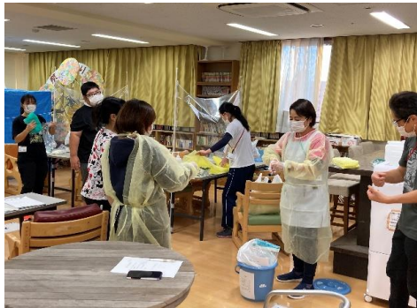
各種研修も実施！各専門職が担当します！