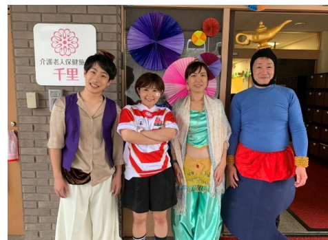
地域の方と協力して、お祭りも開催します！