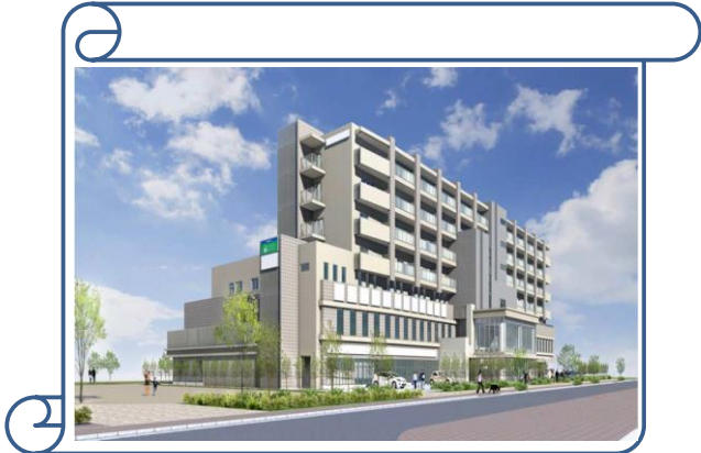
patona吹田健都の外観です