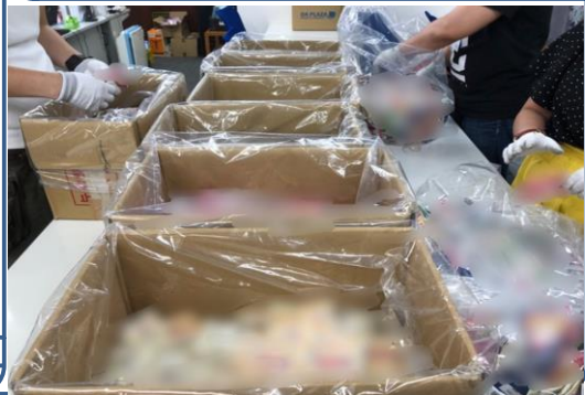
みんなで協力してお菓子の振り分け作業中です。