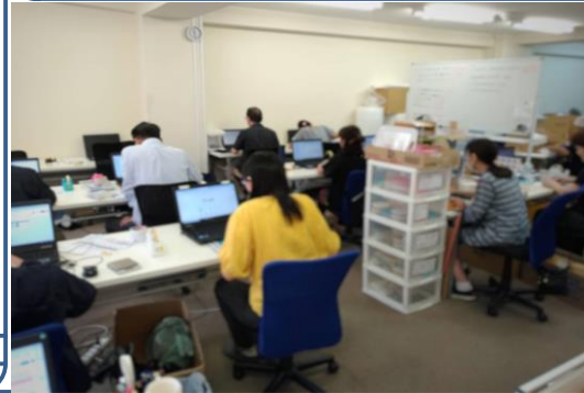
PCを使ったネット販売も！