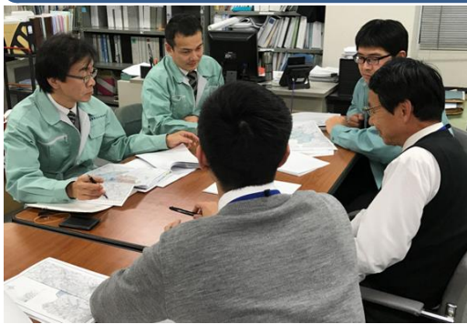
業務にあたってコミュニケーションを重視しています