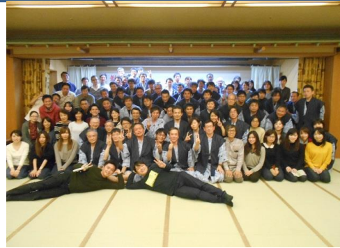
社員旅行等のイベントで親睦が深まります！