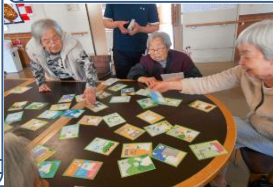
今年のお正月遊びの様子です。