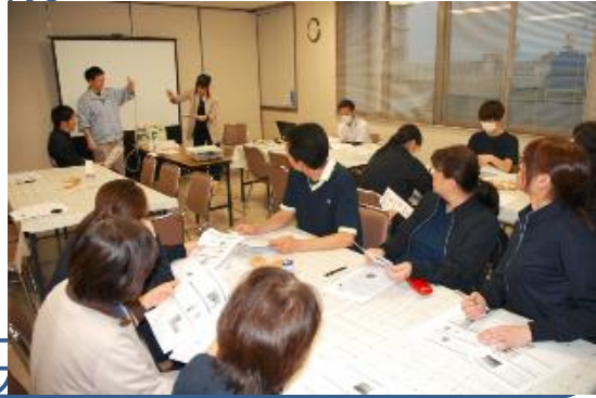
スキルアップ向上のため定期的な研修を行っています。

アピールポイント 社会福祉法人済生会の運営する施設なので安定した職場です。安心して長く勤めていただけます。20歳から70歳まで幅広い年齢層の職員が在籍しているので、何歳の方でも安心してご応募下さい。