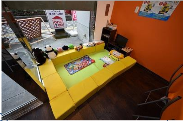
キッズルーム完備でご家族のお客様にも対応♪