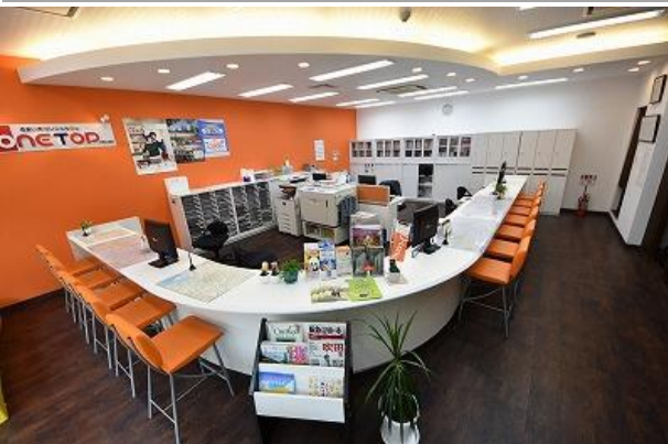
お洒落な店内です♪