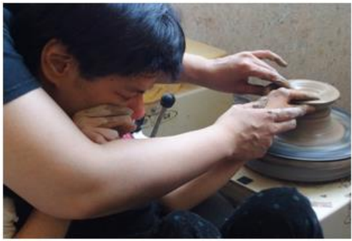
利用者の笑顔が増えるように