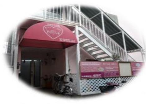
吹田の街で障がいをもった仲間が、地域であたりまえに暮らすため、寄り添いあう地域法人に！