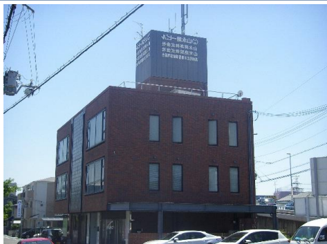
弊社自社ビルになります。