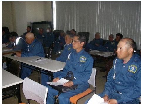
年に2回、自社で現任教育を行っています。