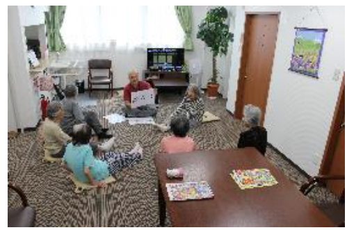
認知症の方と、輪になって、頭と体の体操

アピールポイント 高齢者介護で一番力をいれていますのが、認知症介護です。認知症でも色々な病状がありますが、なるべく穏やかに暮らせるよう当社では、2か所の認知症介護グループホームを運営しております。一緒に喜び、一緒に悩んで毎日を穏やかに過ごせる様日夜頑張っております。ガッツリ介護ではなく、介護補佐でも勤務可能です。