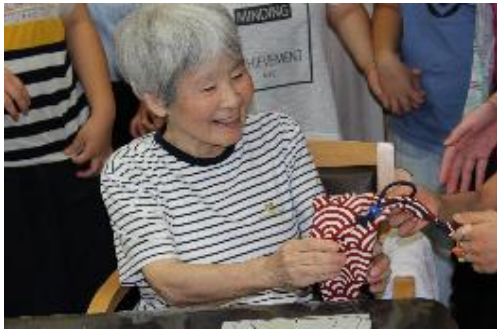
障がい児と高齢者との交流風景