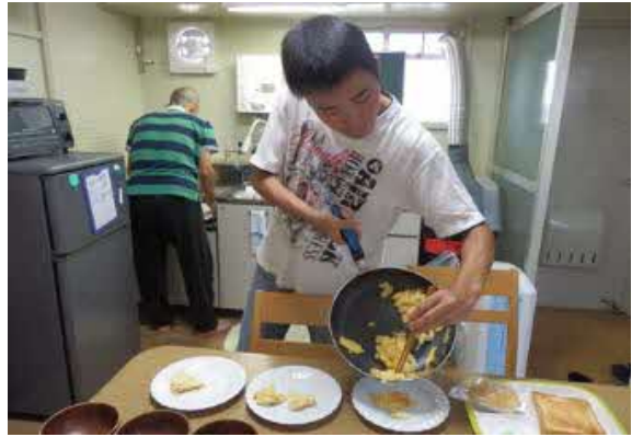
グループホームでの共同生活をしているメンバーさん