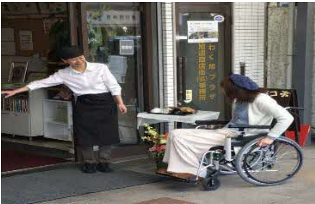
車いすのお客さまにやさしく接するメンバーさん