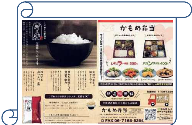
お米にもこだわったお弁当です。法人対象ですが、お弁当1個からのご注文承ります！！