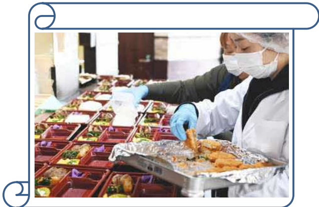
1つ1つ手作業で愛情込めて盛り付けてます♪