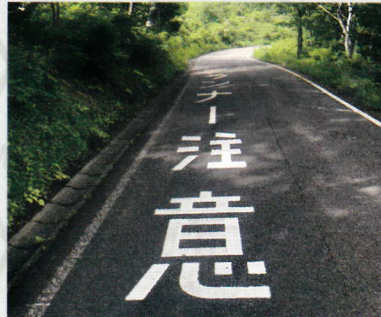
ランナーに配慮したロードマーカー

ロードトレーニングに 集中できるように、 ランナーの安全に配慮した ロードマーカーを路面表示!!