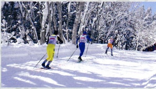
全日本スキー連盟公認クロスカントリースキーコース