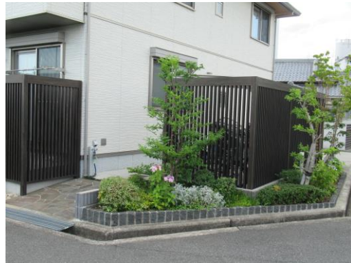
建物と調和する色調のルーバーで囲んでいる駐輪場の例