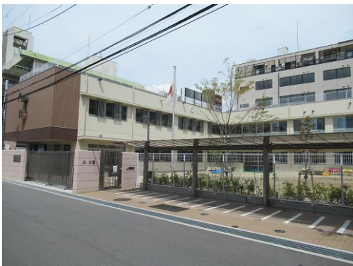
建物と調和する色彩の製品（既製品）を選定し、設置している例