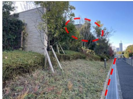
道路境界に植栽帯を設け、機械式駐車場を見えにくくしている例