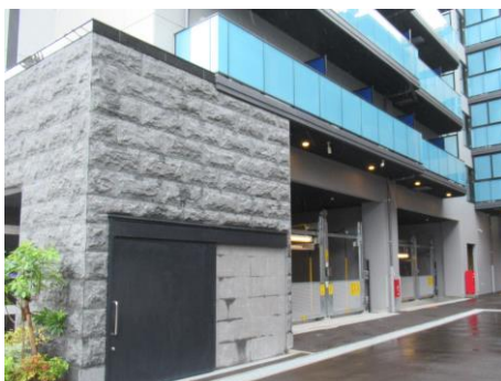
建物の内部に駐輪場をつくり、道路などの公共空間から目立たないようにしている例