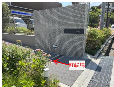
敷地の奥に駐輪場を配置し、敷地に植栽を設けている例