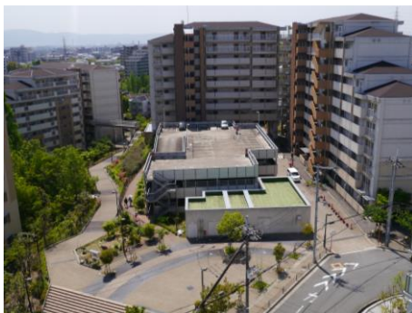
敷地の奥に立体駐車場を配置し、圧迫感を低減している例