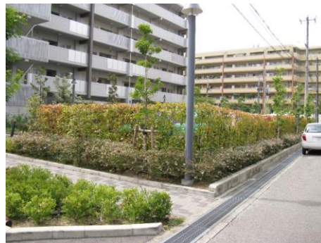
敷地の前面に植栽を設けて、駐車場を見えにくくしている例