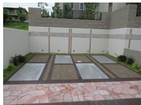
舗装材を組み合わせている例