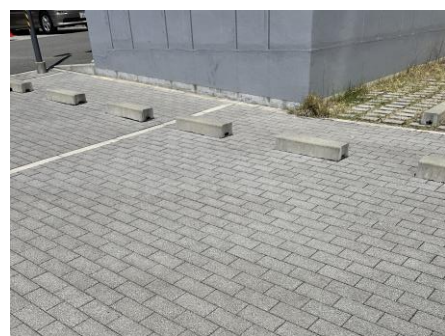
ブロック舗装を用い、表情のある仕上げとしている例