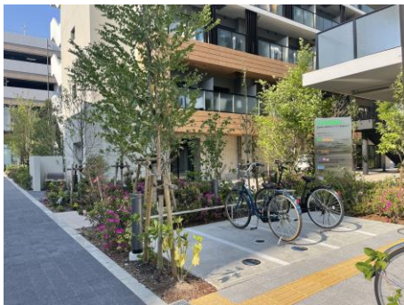
駐輪場を植栽で囲み、印象を和らげている例