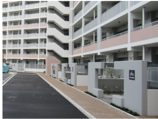
建物と調和するデザインの駐輪場の例