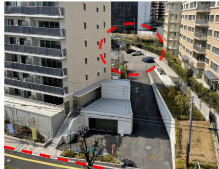
駐車場を敷地の奥に配置し、通りから見えにくくしている例