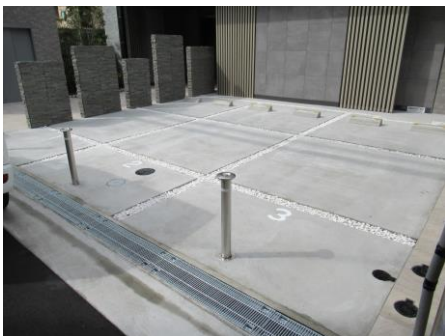
土間コンクリートの目地に玉石や地被植物を植えることで、表情のある仕上げとしている例