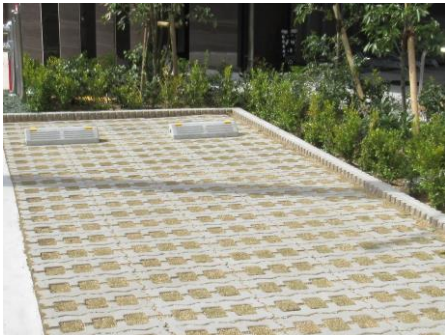
緑化ブロックで舗装し、環境面にも配慮している例