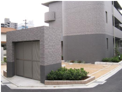
建物デザインと配色を合わせたごみ置場の例