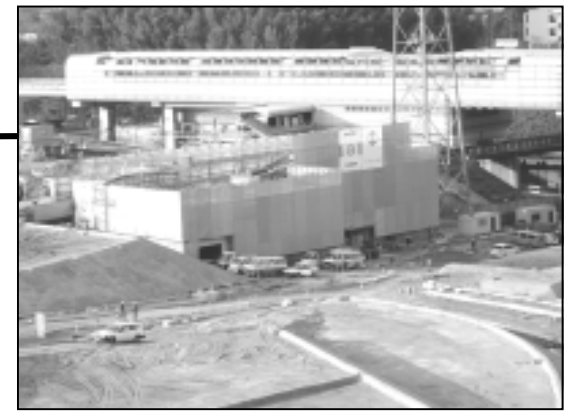
山田駅東公園 (植栽や遊具が設置されています)