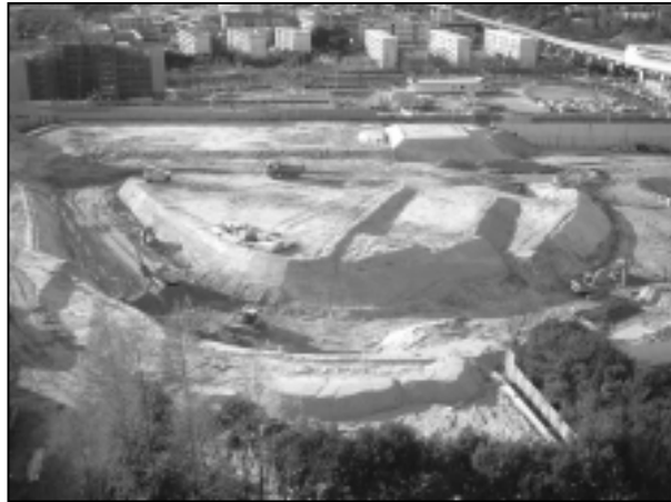
区画整理区域内 (千里ガーデンハウス屋上より撮影)

駅東側で行われている都市再生区画整理事業は、平成13年度に、造成・下水道・擁壁・防火水槽などの工事を進めています。