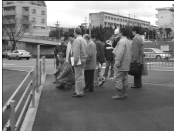
安全パトロール (平成14年1月21日撮影)

山田駅周辺地区では、事業の進捗に合わせて、周辺のまちの安全対策を点検するために、昨年7月から月に1回ほど、安全パトロールを行っています。