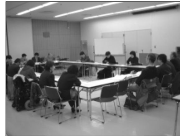
山田駅周辺まちづくり懇談会(平成13年12月20日撮影)

まちは生きています。そして、そこに住む人、働く人、訪れる人、すべての人の息づかいとともに、まちは育まれていきます。