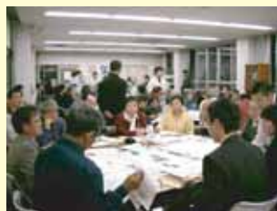
▲ワークショップ開催風景