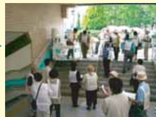
▲タウンウォッチング開催風景

第1回のワークショップで行ったタウンウォッチング(現地点検)では、現況の課題を細かくチェックしました。