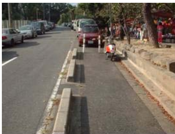
吹田市民会館までの道は坂道になっており、移動に負担を伴います。