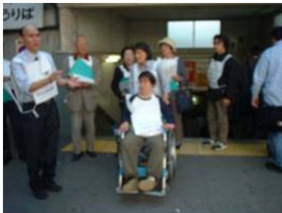
阪急豊津駅は階段が多く、移動に負担を伴います