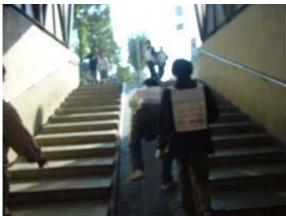
阪急吹田駅は、駅を降りてから東西の移動に構外の地下道を利用する必要があります

吹田・豊津地区では、バリアフリーに配慮して改装した旭通商店街等、随時整備を進めてきました。しかし、駅舎や歩道には、大きな迂回や垂直移動を要するバリアが点在しています。本基本構想に基づき、関係機関が今後協議を進めながら、これらのバリア解消にむけて積極的な取組みを進めていくことが必要です。