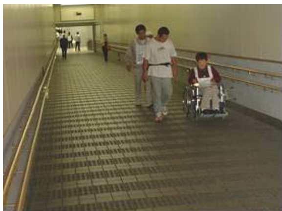
JR吹田駅の東口改札方面のスロープは非常に長く移動が大変です。ホームから中央改札までは階段のみです。