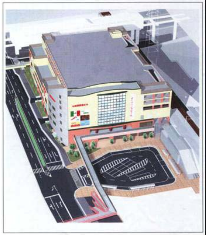
やまだえきしゅうへんせいびじぎょう 山田駅周辺整備事業

近い将来、新たに生まれ変わる山田地区は、吹田市の先進事例となるバリアフリーなやさしいまちにすることをめざしていきます。