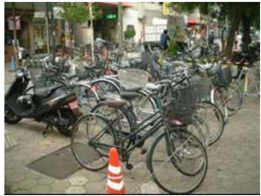
広くて通りやすい歩道のは ずなのに・・・