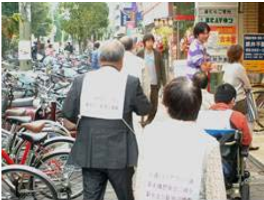
タウンウォッチングでも 歩道を通るのに四苦八苦

これまでバリアフリー整備を随時進めてきていますが、基本構想の中で、さらに質の高いバリアフリー整備を今後とも進めていくものとします。そして、人が集まり、よりいっそう賑わいのある地区となることをめざしていきます。