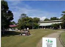
13. 有料バーベキュー場