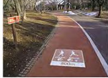
8. ジョギングコース