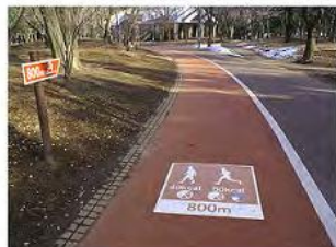
5. ジョギングコース