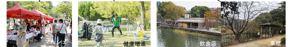
※写真の施設、取組、ゾーン等はイメージであり、決定した事業計画ではありません。 また、ゾーンの全範囲で展開するものではありません。