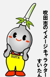
吹田市のイメージキャラクター すいたん

アドレス： https://www.city.suita.osaka.jp/shisei/organization/1018775/1009496.html