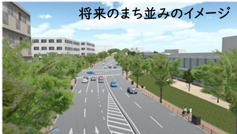
将来のまち並みのイメージ

グリーンインフラとは、道路・公園などを整備する際、 自然環境が有する多様な機能を活用し、持続可能で魅力ある地域づくりを進める取組 です。