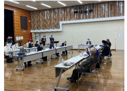
審議会開催の様子

令和4年11月11日開催の「佐井寺西土地区画整理審議会(第5回)」において、仮換地の指定等について諮問を行い、適正である旨の答申を得ました。この答申を受け、令和4年11月25日付けて施行地区内の全ての地権者の皆様に対して、仮換地の位置、地積及び効力発生日等を通知する「仮換地指定通知」を発送し、佐井寺西土地区画整理事業における仮換地の指定を行いました。