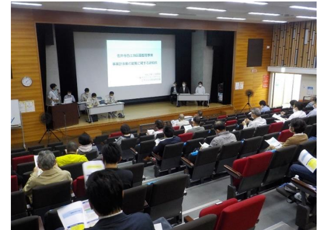
◆縦覧に関する説明会の様子