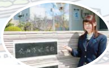
泉浄水所 竣工年度:昭和38年度(1963年度)