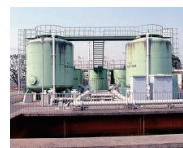
現在の片山浄水所