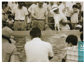
当初の入園者数は年間80,234人