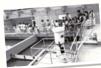
浄水所見学の様子