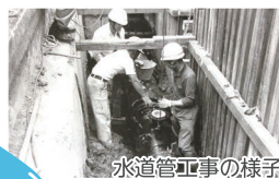
水道管工事の様子