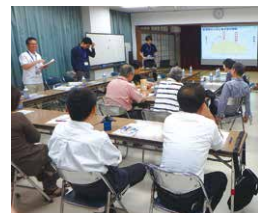
水道いどばた会議の様子