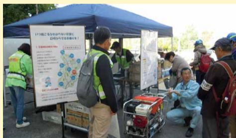
応急給水訓練の様子

災害時により円滑な応急給水ができるよう、水道部 にご協力いただける連合自治会を対象に、応急給水訓 練を実践していきます。