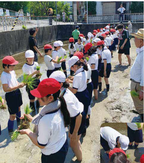
江坂大池小学校 田植えの様子