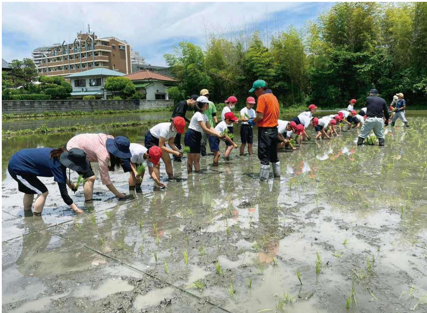
写真は山田第一小学校の田植えの様子