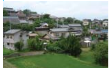
佐井寺旧集落のまちなみ