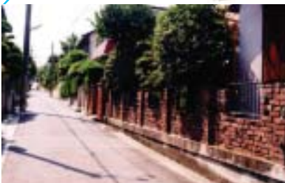
千里山のまちなみ