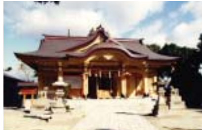
佐井寺伊射奈岐神社