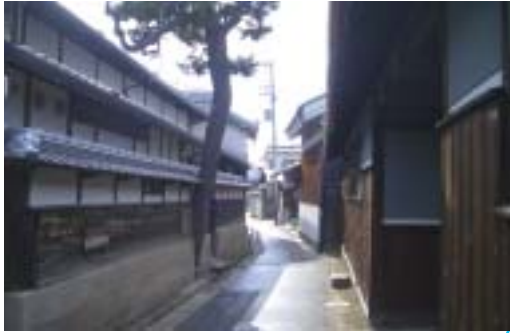
蔵人旧集落のまちなみ