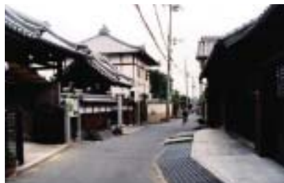
旧吉志部東村のまちなみ