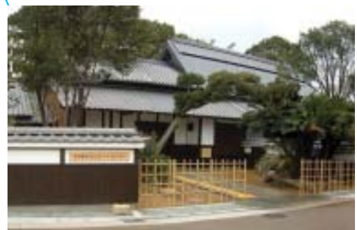
歴史文化まちづくりセンター(浜屋敷)