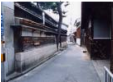
蔵人旧集落のまちなみ