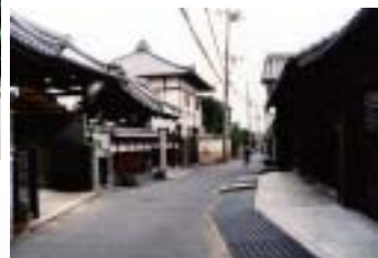
旧吉志部東村のまちなみ