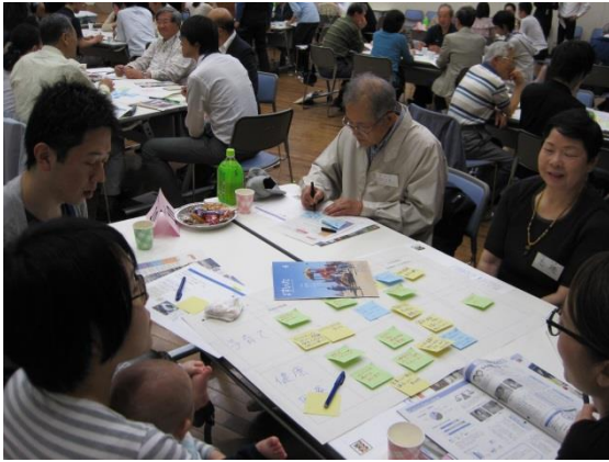
図表7 ワークの様子