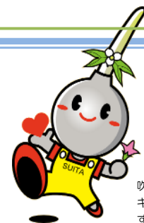
吹田市イメージ キャラクター すいたん