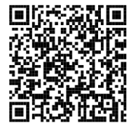
自治会情報登録 のページ

「認可地縁団体」は、告示事項の変更等の手続きが必要ですので、市民自治推進室にお知らせください。