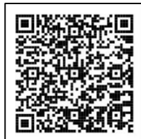
吹田市洪水ハザードマップ