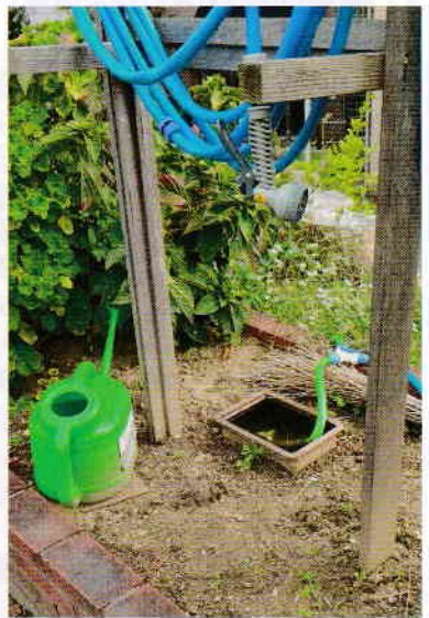
水やり用のホースとじょうろ

役所より草花の提供がある。）や水やり用のホースの整備と水やり、雑草木の剪定や除去、などを行っています。