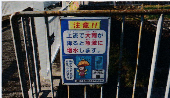
糸田川増水の注意書き

公園の生垣の木が抜けてズタズタになって路に出るのであぶない。何とかならないか。市から対処するという返答をもらった。