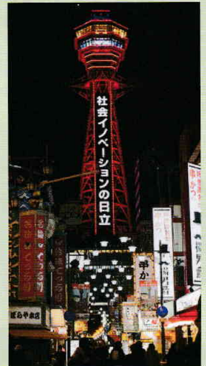
通天閣と太陽の塔が 赤く染まった