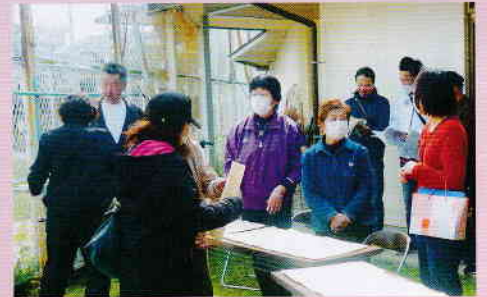
集会所が閉鎖中は班長会 は外で資料配布