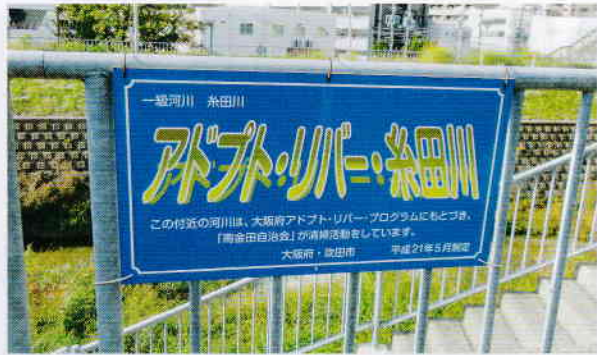
この河川は南金田自治会が清掃活動をしています

今回は、アドプトリバーと環境部の活動と皆様へのご協力をお願いについてお伝えしたいと思います。 糸田川の南金田区域はアドプトリバーに指定されており、アドプトとは、養子縁組するという意味とされています。つまり、リバー（川）糸田川又はその周辺と南金田自治会との間に養子縁組し、河川及びその周辺を大切に育てていくというものです。