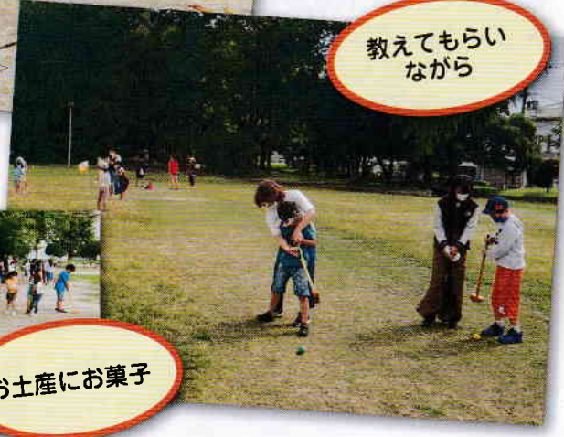
教えてもらいながら