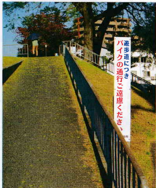
糸田川の「バイクはご遠慮」の看板