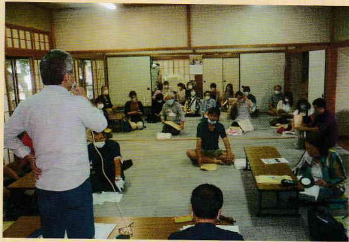
班長会は密を避けるため 2部に分けて実施