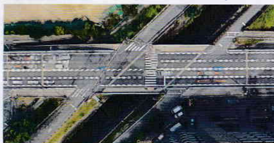
新糸田川橋の上空写真

示がある。小太郎寿司のところが坂はそう いう表示がないのでバイクは禁止ではない 慮ください」と表示している。