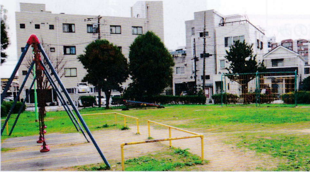
南金田公園の遊具

南金田公園には遊具が少ない。市に問い合わせると、今ある遊具に不具合があれば補修をしていく。南金田公園は補修する必要はないので、新設することは考えていない。公園の遊具は