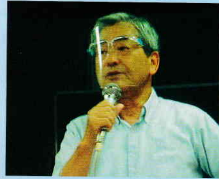
感染を防ぐため フェイスシールドをつけて挨拶

昨年明け、新型コロナウイルスの感染拡大が報じられる中、役員会は自治会総会を4月から5月に延期することを決めました。ところがその後、感染