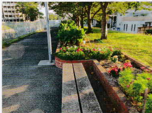
花壇に年3回市から提供される花を植える

とても管歩の加清と願よつは（ける植が、 思い力理道管え掃環と思い ました入ど安や花動部思 すいれに全遊壇にもす。