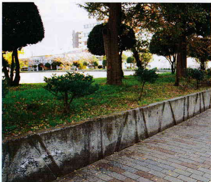
南吹田公園の生垣

糸田川の道路にバイクが通ることがあり危ない。「バイクの通行ご遠慮ください」という表示があるが禁止にはなっていない。バイクは通れるのか。