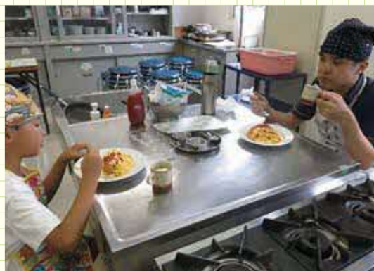
親子で、「いただきます」。