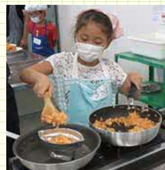
チキンライスの形を整えて…。