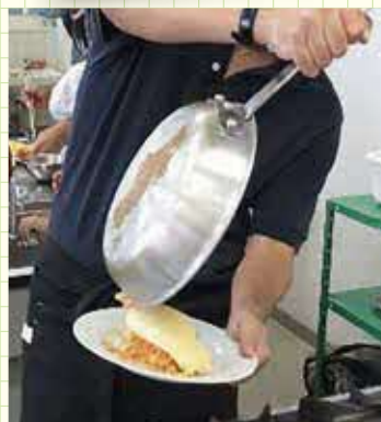
見事なフライパンさばき!