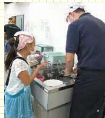
後片付けもカンペキに。