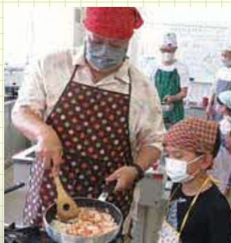
初心者は、強火は扱いが難しいので、常に中火で炒めます。