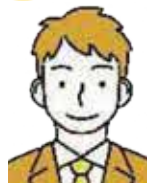
Nさん (大学2年生から 5年間活動 現在小学校教員)

授業内容は暴力を含むセンシティブなものですが、楽しんで学べるように工夫を凝らしました。生徒たちから「楽しかった」という感想が多かったときは、努力が報われたようでうれしかったです。