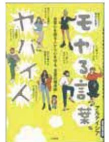
講師著書 「モヤる言葉、ヤバイ人 ～自尊心を削る人から心を守る言葉の護身術」