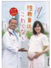
田中 まゆ・山分 ネルソン 共著 「みがかえなくても大丈夫! 性教育はこわくない」