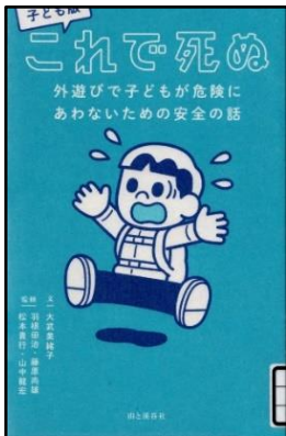
大武 美緒子/文 羽根田 治他/監修 山と溪谷社 786

実際にあった事例を元に、自然の中や街で起こる危険を回避、対処する方法について、28のパターンで紹介しています。