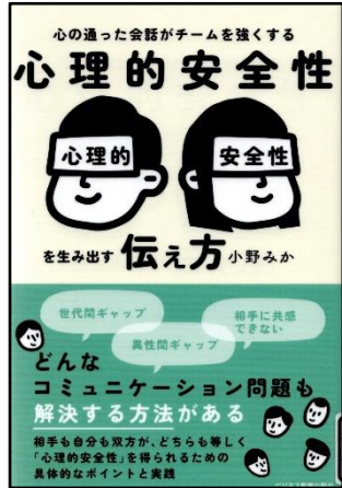
小野 みか/著 ビジネス教育出版社 336.3

相手に安心感を与えることで、コミュニケーションは円滑に進み、良い関係性を築くことができます。その方法を学び実践すれば、家庭や職場など、様々な場所が安心できる場所になります。