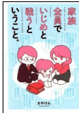
さやけん/著 KADOKAWA 726.1