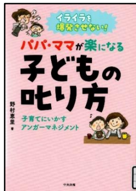
野村 恵里/著 中央法規出版 379.9

イライラを爆発させない！ パパ・ママが楽になる 子どもの叱り方 子育てにいかすアンガーマネジメント