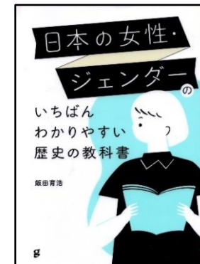
飯田 育浩/著 グラフィック社 367.21

歴史分野の編集・執筆に長く携わり、ひとり親でもある著者が「日本の女性史」についてまとめた本です。新たな視点で歴史をひも解いてみませんか。