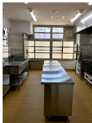
調理室を整備しました