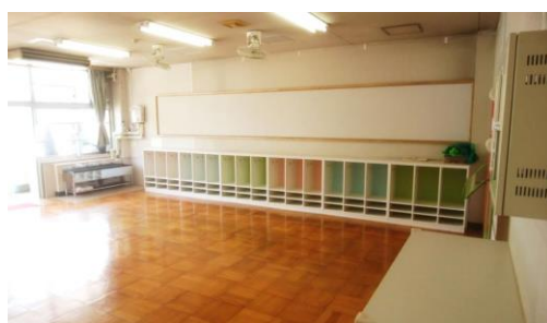
3歳児用の保育室に改修しました