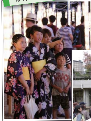
吹田まつり 毎年夏に開催