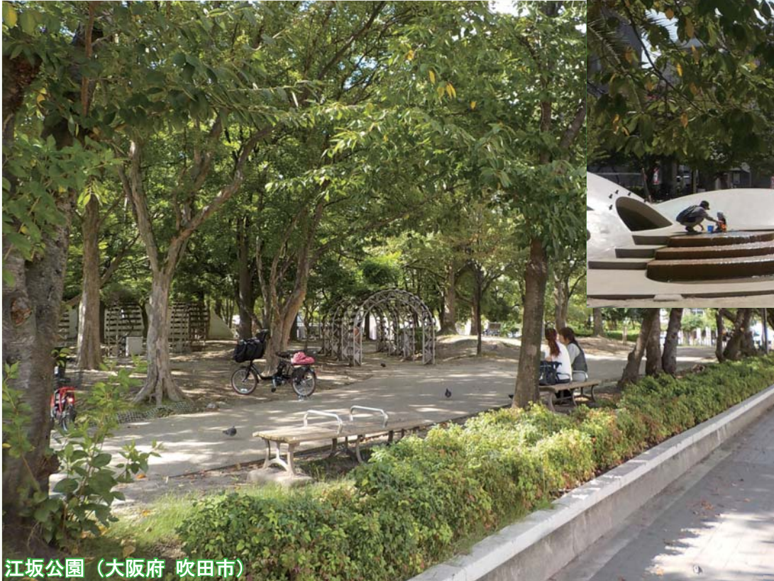
江坂公園（大阪府 吹田市）