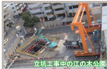
立坑工事中の江の木公園

貯留管工事の立坑用地となった江の木公園の復旧の際に、様々な年代からニーズのある公園へとリニューアル。公園の地下には貯留した雨水の排水ポンプが設置されています。