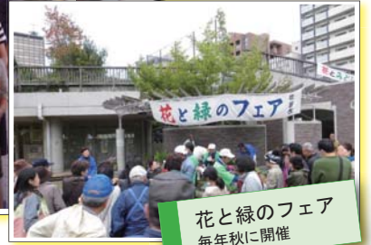
花と緑のフェア 毎年秋に開催