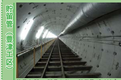
貯留管（豊津工区） 管径 3.75m 延長 1.3km 貯留量 15,000m 3