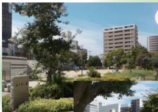
リニューアル後の江の木公園