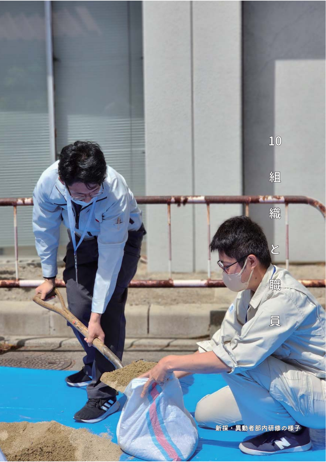
新採・異動者部内研修の様子